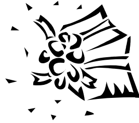
クリップアート・行事

アメリカン・クラシックの代表ともいべきコーチのバッグ。コーチは1941年に創業された。1階に14のステッチを施し、全部で100にわたる工程をへて作り上げられる。